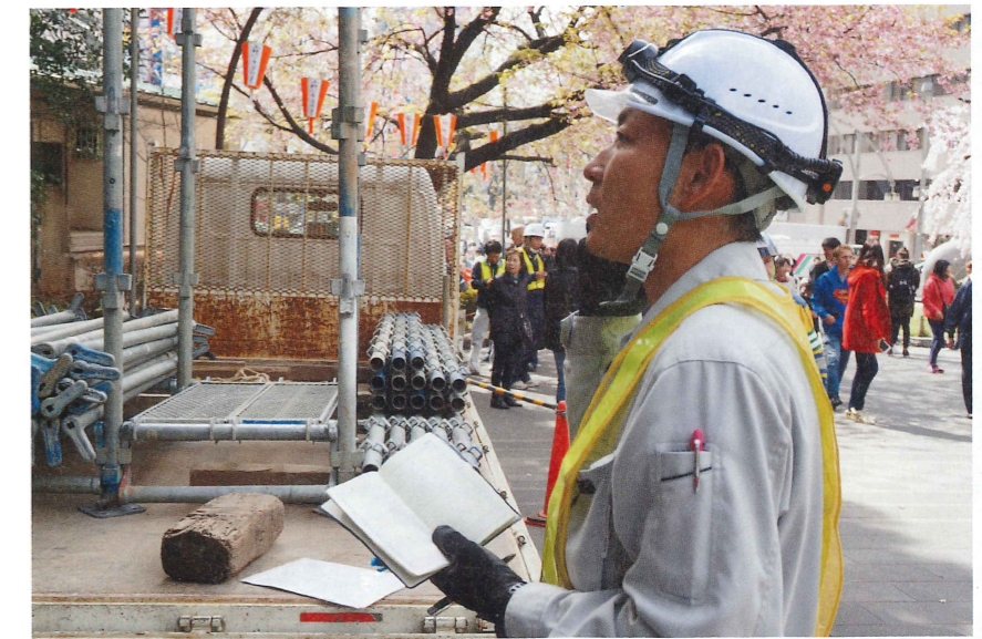
良い現場監督とは、働く人にとって動きやすい環境をつくる人です。「この監督のもとなら働きたい」と思われる人に成長してほしいと願っています。

現場で流した汗が、カタチとして街に残る仕事です。やる気と成長しようという意欲がある人なら、年齢や性別、経験は問いません。ぜひ一緒に頑張らしましょう。